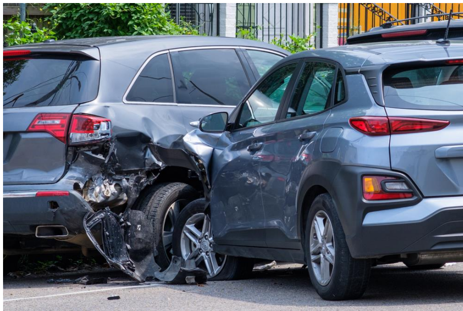
Photo non contractuelle : crédit photo William A. Morgan / Shutterstock