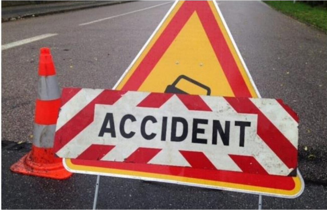
Quatre personnes hospitalisées hier.