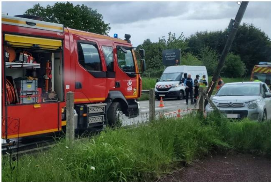
Un accident a eu lieu à Domfront-en-Poiraise dans l'Orne, mercredi 15 mai 2024, dans le secteur de La Croix des Landes. (©Document transmis au Pubicateur Libre)