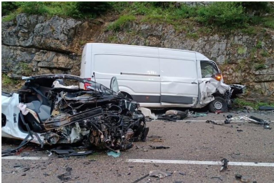
Le choc frontal entre la camionnette et la voiture a eu lieu peu avant 20 heures au col de la Savine, au niveau de Saint-Laurent-en-Grandvaux, sur la route nationale 5, ce dimanche 30 juin 2024.