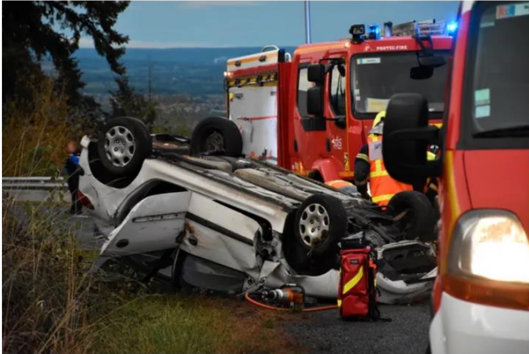
La voiture s'est retournée sur le toit, sur la Départementale 53.