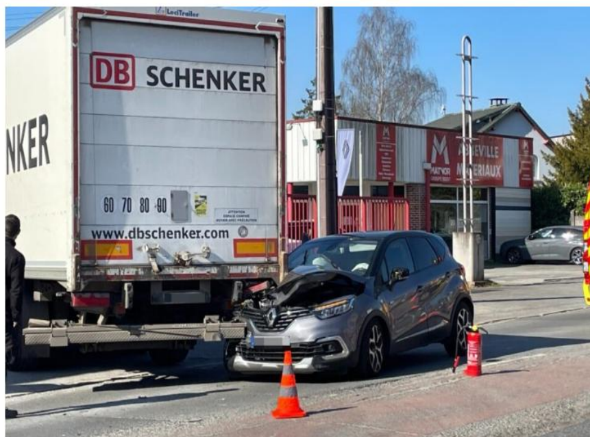
L'accident n'a heureusement fait pas de blessé grave.